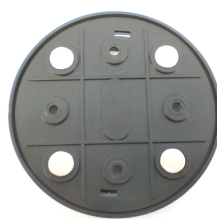
Halteplatte A (Rückseite)